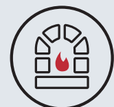
6. Dostawa systemu